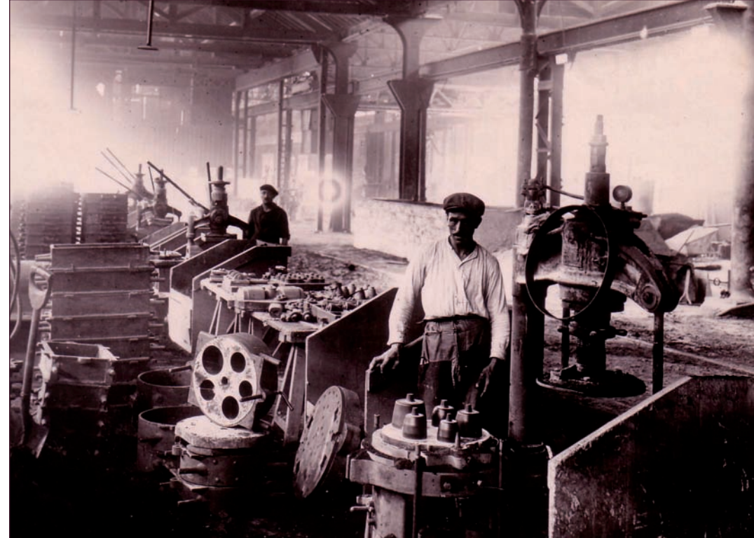
AM de Saint-Chamond, 2 Num 1/33