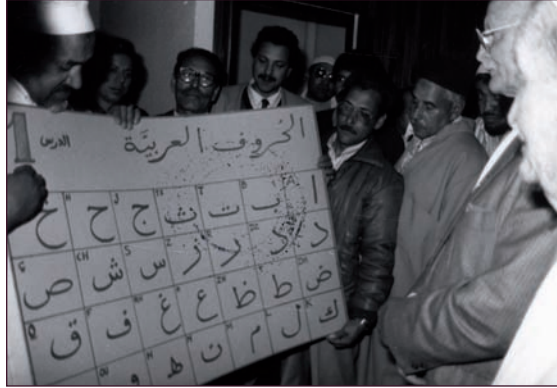
AM de Rillieux-la-Pape, 1 Fi 180