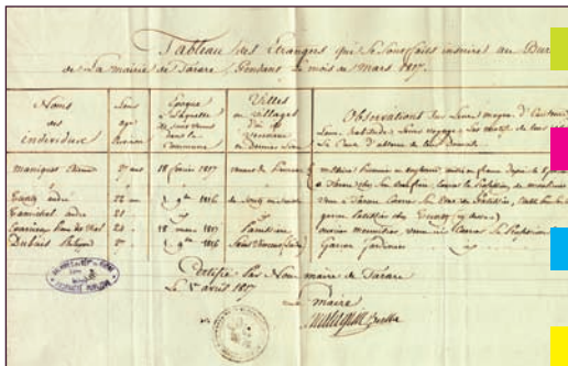
AD du Rhône, 4 M 401