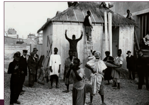
AM de Lyon, 8 PH 4738