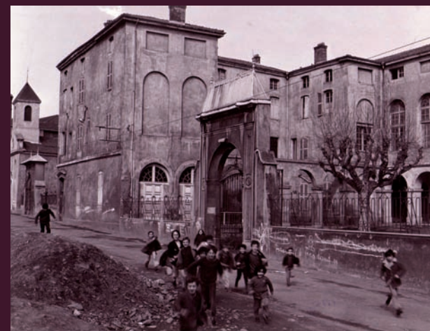
AM de Saint-Chamond, 3 Fi 104

Mais ces archives se caractérisent également par leur fragilité. Les périls qui les menacent sont nombreux : manque de place, mauvaises conditions de conservation, dispersion des fonds, disparition des organismes ou des personnes détenteurs, méconnaissance de leur intérêt potentiel pour la recherche, etc. Cette fragilité menace l'étude et la transmission de cette facette de notre histoire commune : la préservation de ces archives revêt donc une importance capitale.