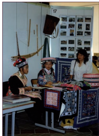
AM de Rillieux-la-Pape, 1 Fi 741

La remise de documents à un service public d'archives est très simple. Elle peut revêtir deux formes : le don et le dépôt.