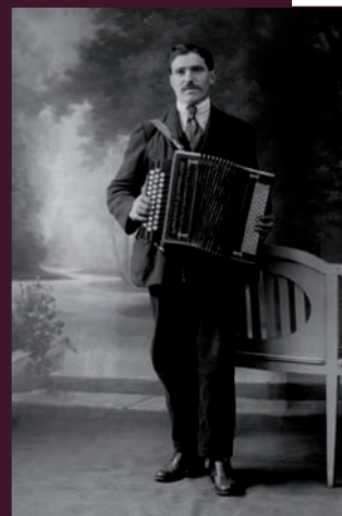
AD de la Loire

En Rhône-Alpes, terre d'immigration depuis plusieurs siècles, l'histoire des immigrés est indissociable de celle du territoire. Celui-ci a été façonné par l'arrivée, l'installation et l'implication des vagues migratoires successives. La reconnaissance de cet apport des étrangers à l'histoire culturelle, politique, économique et sociale commune passe par une meilleure connaissance de cette histoire de l'immigration. Or les archives sont le principal matériau de l'historien.