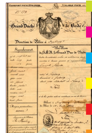
AD du Rhône, 4 M 284