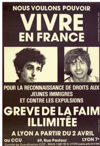
AM de Lyon, 6 Fi 1546