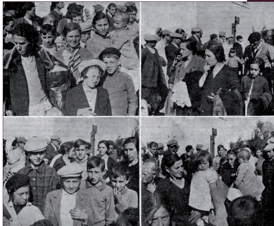
AD de l'Ain, 505 Presse 5

Un don est définitif, un dépôt peut être révoqué.