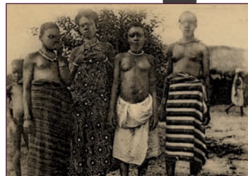
AM de Lyon, 4 Fi 4456