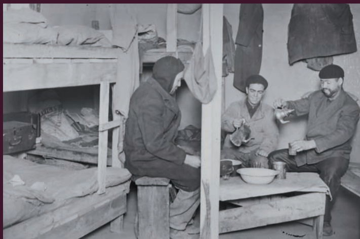
AM de Saint-Étienne, 5 FI 8429

Les archives de l'immigration se révèlent d'une extrême diversité quant à leurs origines et à leurs supports.