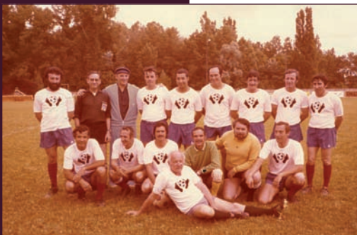
AM de Rillieux-la-Pape, 1 Fi 602